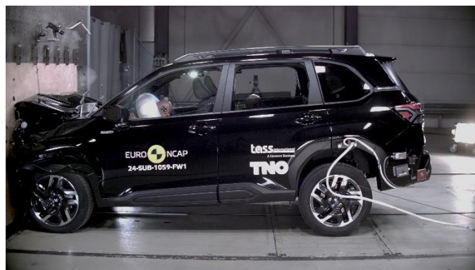
Снимки от теста на SUBARU FORESTER